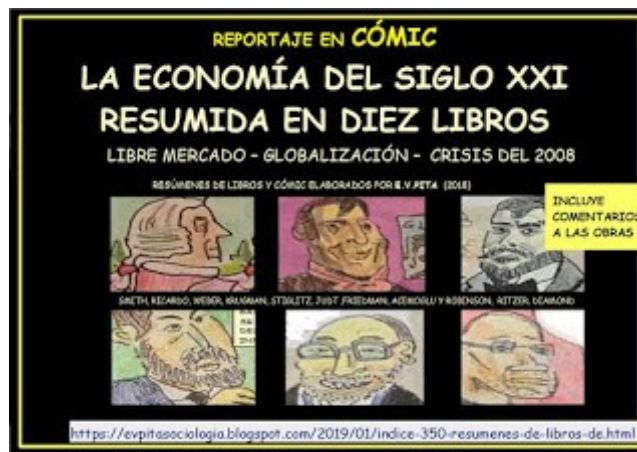
Reportaje en cómic "La economía del siglo XXI resumida en diez libros" (E.V.Pita, 2019)

https://evpitasociologia.blogspot.com/2019/01/reportaje-en-comic-la-economia-del.html