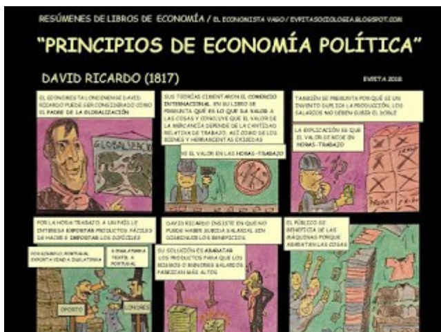
Crónica periodística en cómic "La economía del siglo XXI resumida en diez libros" Autor: E.V.Pita (2019)

(42 páginas en formato DIN A4 horizontal):