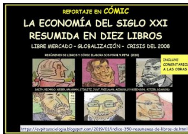
Reportaje en cómic "La economía del siglo XXI resumida en diez libros" (E.V.Pita, 2019)

Descarga en PDF el Reportaje-Cómic "La Economía del siglo XXI resumida en diez libros". Incluye los resúmenes en cómic de diez influyentes libros que reflejan el pensamiento de la Economía Contemporánea del siglo XXI.