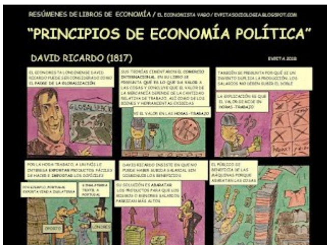
Crónica periodística en cómic "La economía del siglo XXI resumida en diez libros" Autor: E.V.Pita (2019)

(42 páginas en formato DIN A4 horizontal):