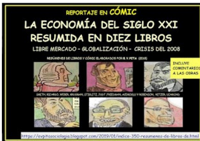
Reportaje en cómic "La economía del siglo XXI resumida en diez libros" (E.V.Pita, 2019)

https://evpitasociologia.blogspot.com/2019/01/reportaje-en-comic-la-economia-del.html